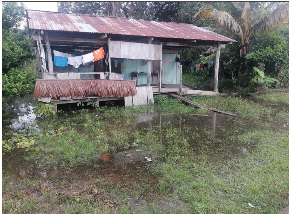
FIGURA N°03: VIVIENDA CON DAÑOS ESTRUCTURALES POR LA INUNDACIÓN DEL RÍO NAPO EN LA COMUNIDAD NATIVA BELLAVISTA.