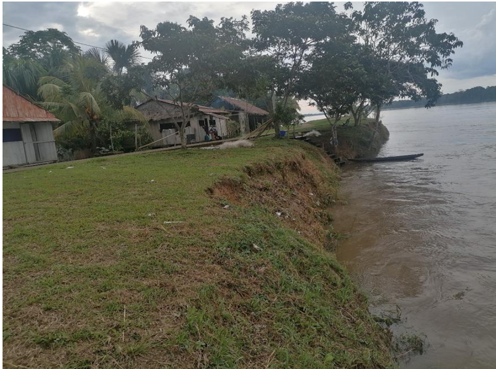
FIGURA N°02: TALUD DE LA RIBERA DEL RÍO NAPO EROSIONADO POR LA FUERZA DEL AGUA, PONIENDO EN RIESGO A LA POBLACION DE LA COMUNIDAD NATIVA BELLAVISTA.