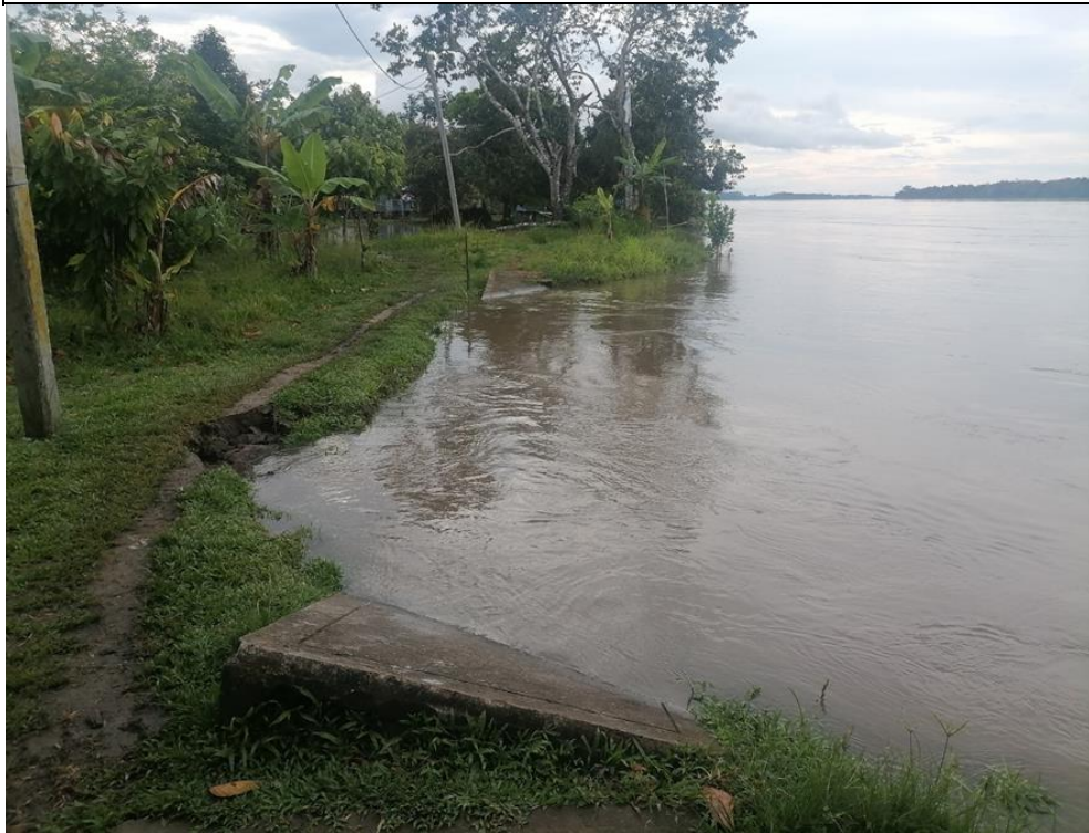
FIGURA N°01: INFRAESTRUCTURAS DE SERVICIOS (VEREDA PEATONAL Y POSTES DE ALUMBRADO PÚBLICO), AFECTADOS POR LA ACCIÓN EROSIVA DE LAS AGUAS DEL RÍO NAPO.